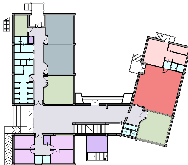
Pianta piano terra