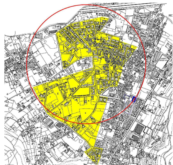
— raggio di influenza 500 ml (ex D.M. 18.12.1975) ■ raggio di influenza reale